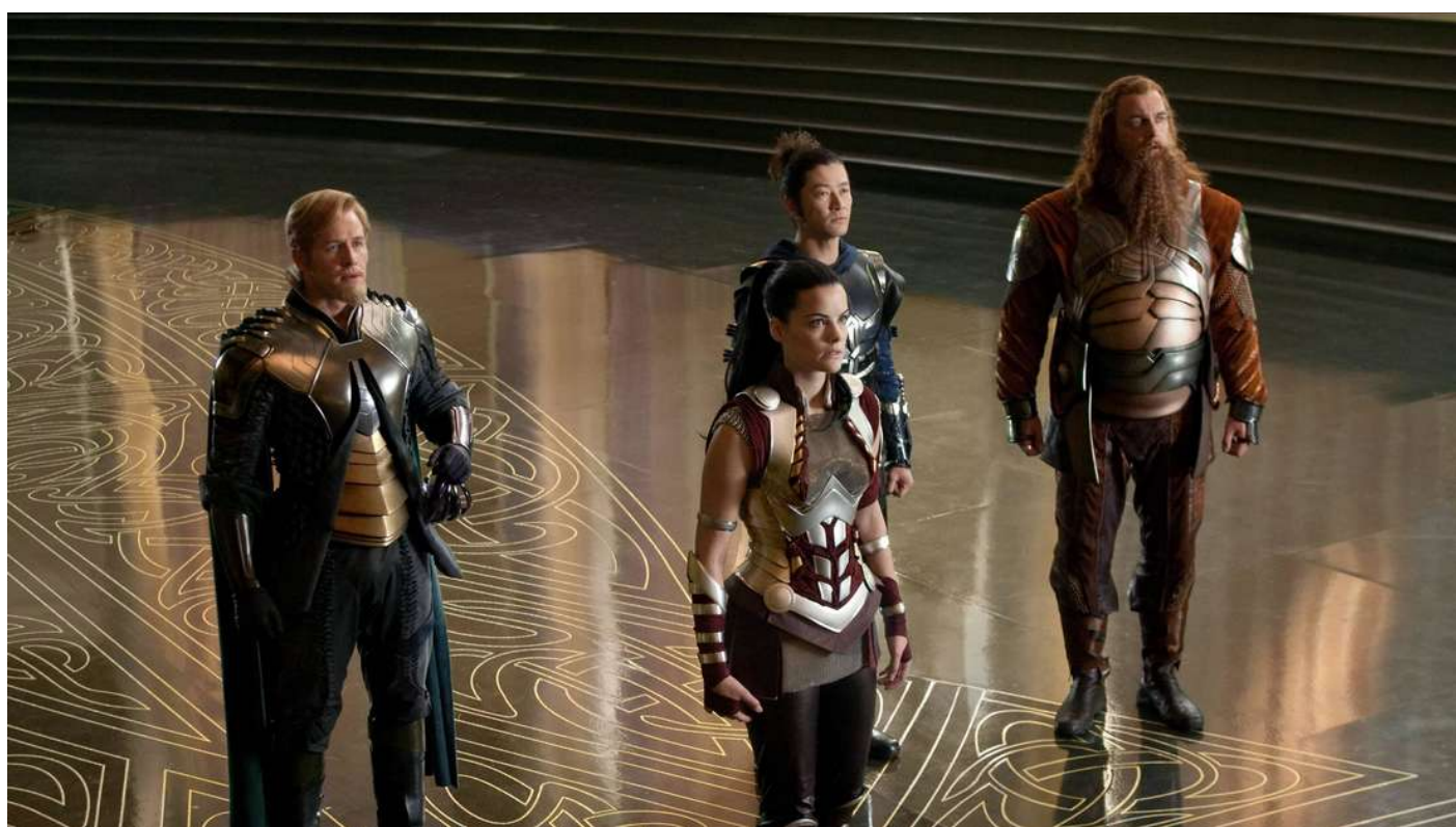
Marvel-Star Ray Stevenson ist bei Dreh-Arbeiten in Italien gestorben. (Archivbild)

Stevenson ist im Alter von 58 Jahren überraschend gestorben. Er soll für Dreharbeiten in Italien gewesen sein. Eine Todesursache ist zunächst nicht bekannt.