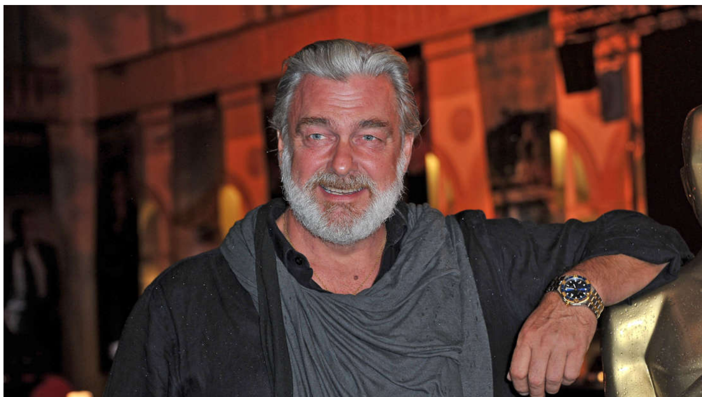
Schauspieler Ray Stevenson starb während Dreh-Arbeiten in Italien. (Archivbild)